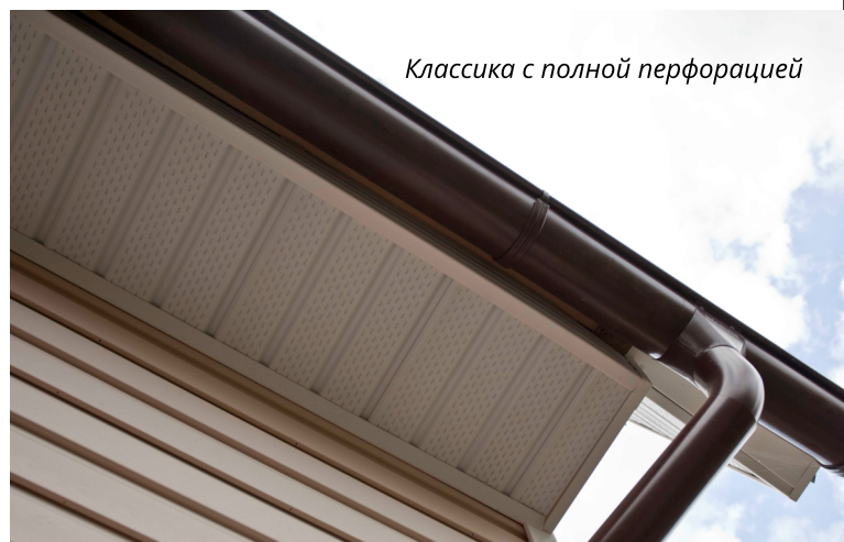
Классика с полной перфорацией