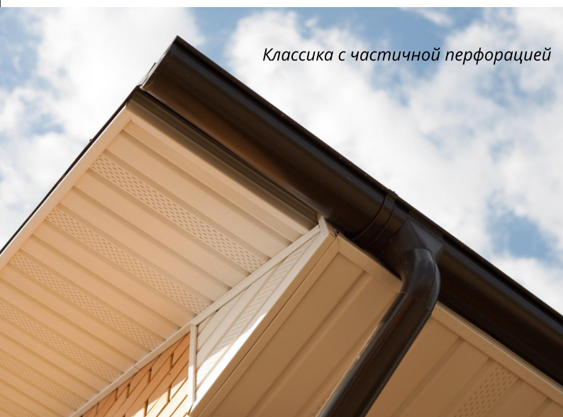
Классика с частичной перфорацией