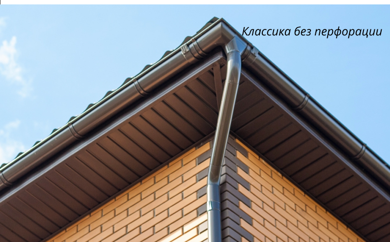
Классика без перфорации

Длина (мм): 3000 Ширина рабочей поверхности (мм): 246 Кол-во в одной упаковке (шт.): 22 Полезная площадь панели (м 2 ): 0,74 Вес нетто одной упаковки (кг): 38,9 Цвет: белый, коричневый