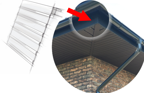
J-фаска (ветровая доска)