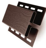
H-профиль Соединение софитов на углах карнизов.