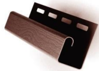
J-профиль Завершающая планка на фронтонах, крепление софитов